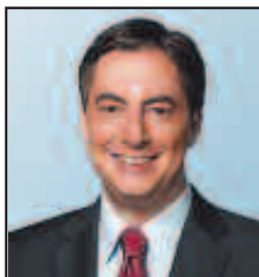
David McAllister Landesvorsitzender der CDU in Niedersachsen Abgeordneter des Europäischen Parlaments

Wir sind stets für die Elbe-Weser-Region auf dem Sprung.