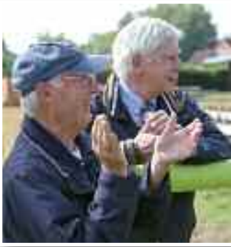
Persönlichkeiten – Stefan Aust und Paul Schockemöhle applaudieren.