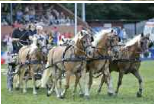
Schaubild – Fahren