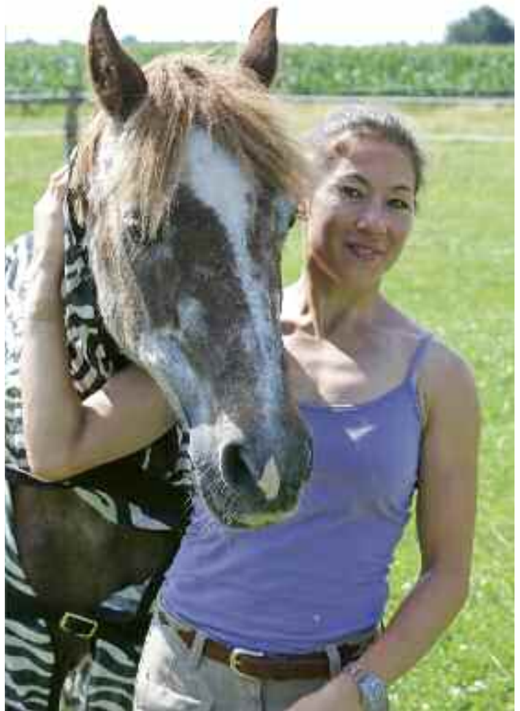
Asterix ist heute 37 Jahre alt und steht bei Mynou Diederichsmeier immer noch auf der Weide.