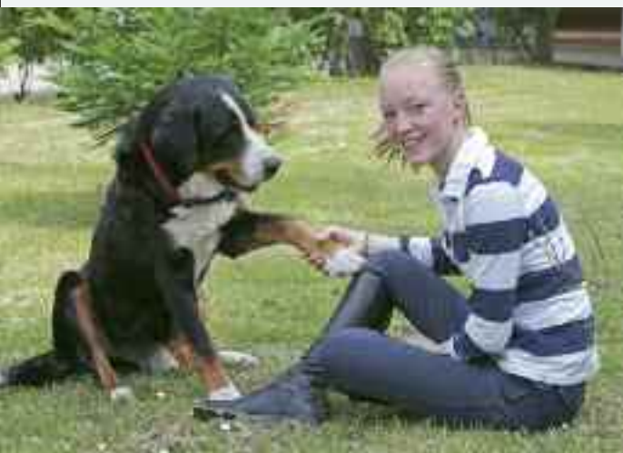
Die 16-Jährige ist fast immer gut gelaunt und tierlieb.