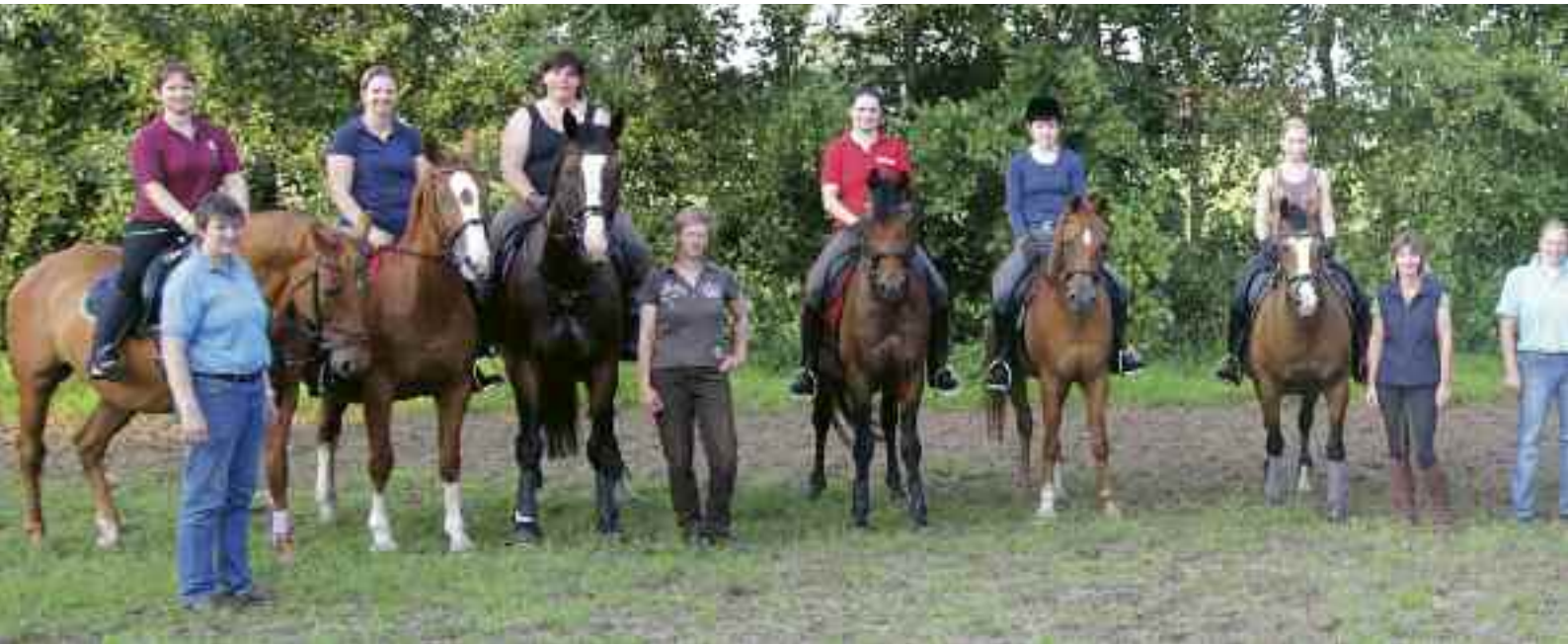
Ein „buntes Völkchen“ – in der 24er Quadrille sind die unterschiedlichsten Pferderassen und Reitweisen vertreten.