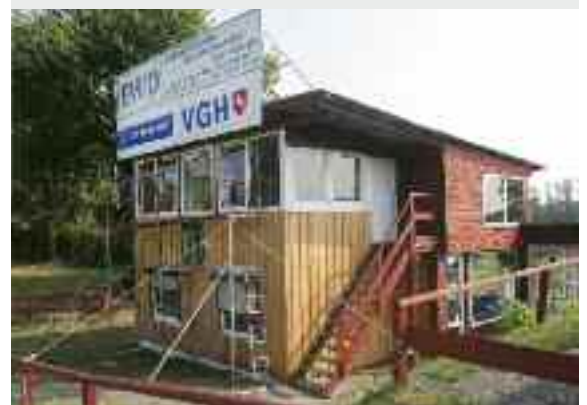
Neue Verkleidung Richterturm