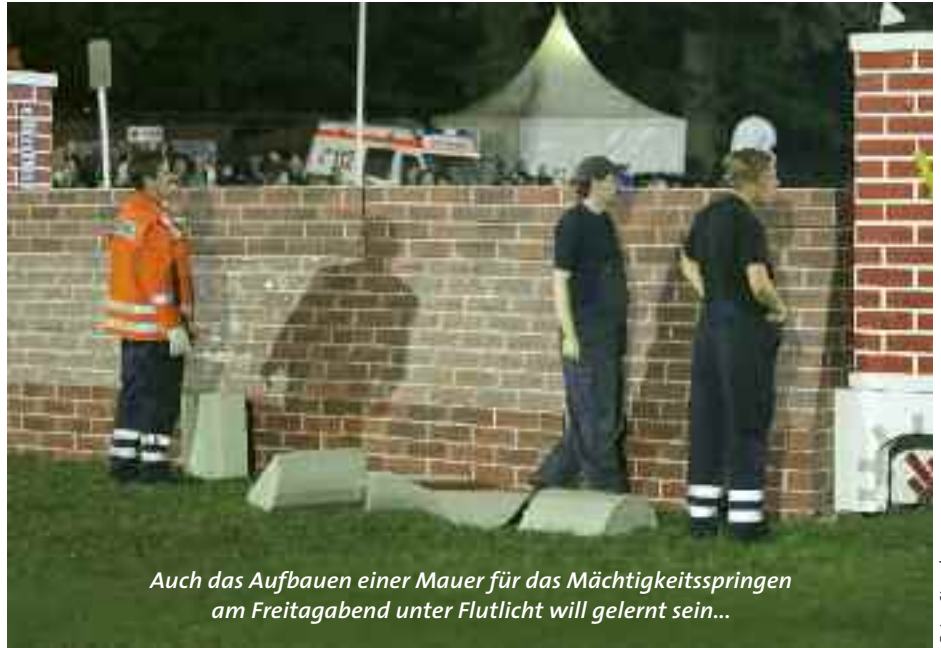
Auch das Aufbauen einer Mauer für das Mächtigkeitsspringen am Freitagabend unter Flutlicht will gelernt sein...

Apropos Wald. Da die Waldfläche in der Region Wingst so groß ist, gibt es die Besonderheit, dass in Westerhamm und auf dem Dobrock gleich an zwei Standorten Feuerwehren stationiert sind. In den dreißiger Jahren des 19. Jahrhundert wurde die Feuerwehr in der Region gegründet. Zurzeit sind 64 Männer und zwei Frauen in der Wehr Wingst aktiv, hinzu kommen noch 16 Ehrenmitglieder. Um sich verstärkt um den Nachwuchs kümmern zu können, soll noch in diesem Jahr eine Jugendfeuerwehr aus der Taufe gehoben werden. Mit vier Fahrzeugen der unterschiedlichsten Kategorien können die Männer bei Bränden, Verkehrsunfällen, Suchaktionen, Tierrettungen, Umzugsbegleitungen oder Hochwasser ausrücken.