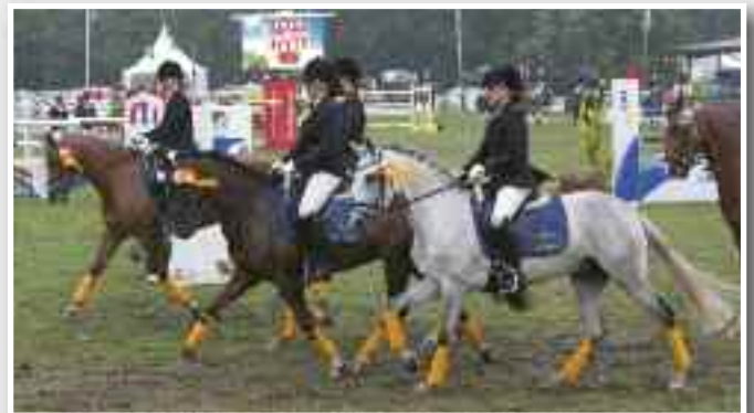
Kreismeisterschaften – Die Alfred Paulsen GmbH unterstützt nicht nur das Mannschaftsspringen der Reitervereine des Unterebeschen.