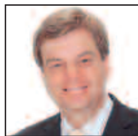
Enak Ferlemann Parlamentarischer Staatssekretär beim Bundesminister für Verkehr und digitale Infrastruktur Bundestagsabgeordneter im Wahlbereich Cuxhaven-Stade II