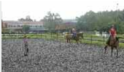
Reitunterricht auf einem der drei Außenplätze.