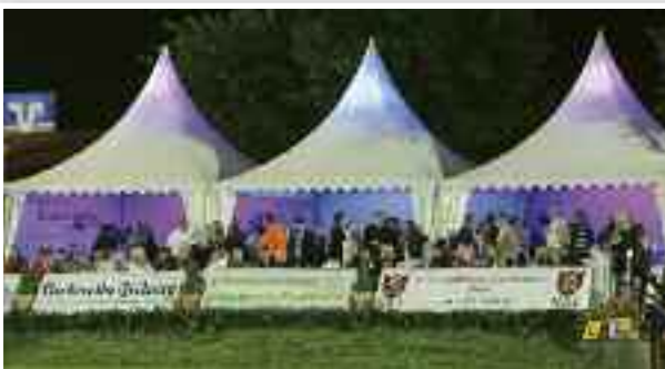
Das Ritterschaftliche Kreditinstitut Stade nutzt das Dobrock-Turnier traditionell zum stimmungsvollen Kundenempfang.