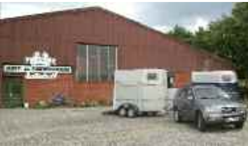
Reithalle und Reiterstübchen.