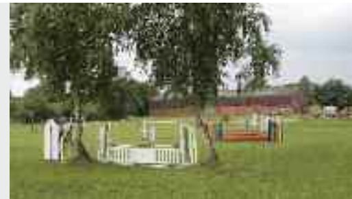
Vereins- und Turniergelände.

tag, Herbstritt, Reitausflüge nach Neuwerk, Monatsreiten, Springgymnastik oder Weihnachtsreiten sind nur einige Beispiele aus dem vielfältigen Angebot des ländlichen Vereins. Lehrgänge und Workshops wie „Wege zum Pferd für Frauen“, „Gelassenheitstraining“ oder „Hindernisreiten kommentieren“ sorgen für Abwechslung im Reitverein und tragen gleichzeitig zur Fortbildung des Vorstands bei.